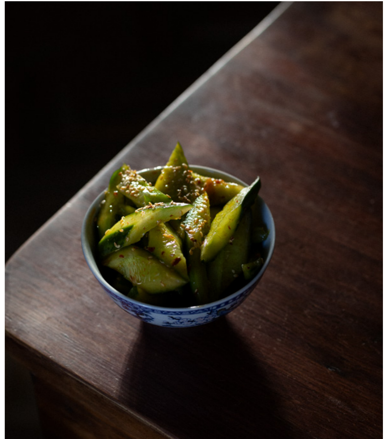
Sałatka z ogórka przygotowana na bazie gotowego sosu