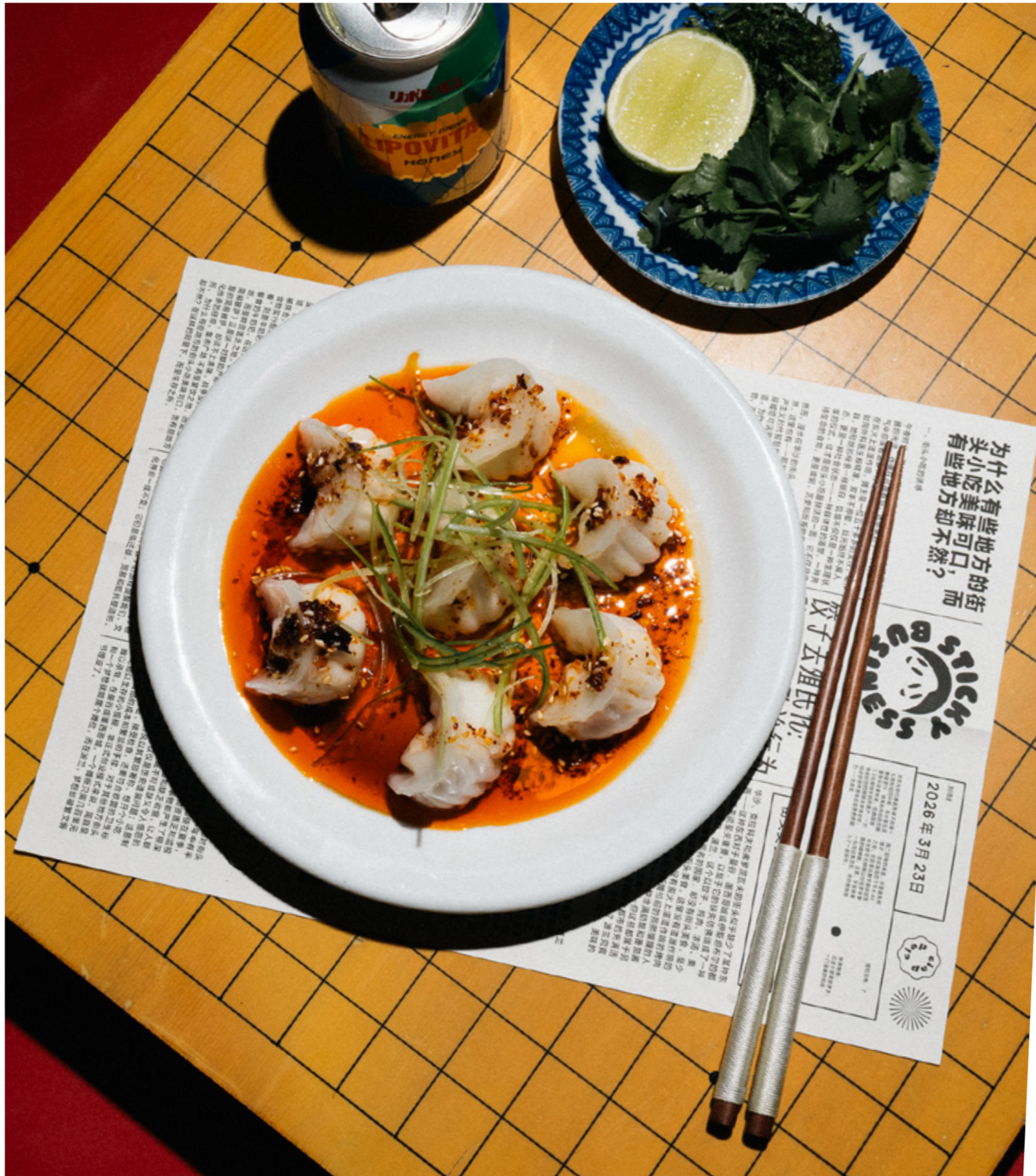
Har Gow z krewetkami i pędami bambusa w oleju chili ←