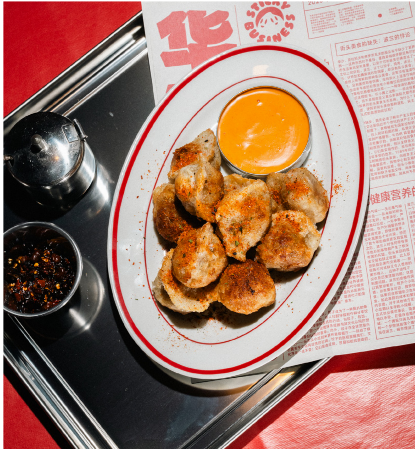
Jiaozi smażone na chrupko, podane jako finger food z dipem do maczania ←